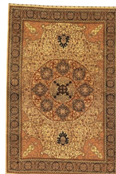
ヘレケ アナトリア中央部 20世紀後期