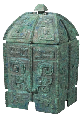
重要文化財 饗養文方彝(史路) 中国 殷(商)時代