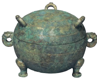
金象嵌渦雲文敦 中国 戦国時代