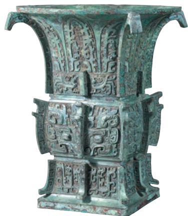
重要文化財 饗養夔鳳文方尊(栄子尊) 中国 西周時代

中国の古代文化を象徴する青銅器。その器形は円形と方形（四角形）の二要素を基 本とします。両要素の調和は、当館所蔵の重要文化財「饗養夔龍文方卣」において見 事に果たされています。それは、古代中国人の「天が円く、地が四角」と いう世界観をも想起させます。もとより円と方は図形の根幹を成す形象であるため、い つ時代の美術においてもこれらを上手に表現することが課題となっています。 本展覧会では、白鶴コレクションを代表する中国青銅器の優品を展示し、その汎用性 のある造形美と制作背景の関わりについて紹介します。