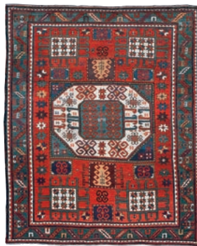
カザック カラチョフ コーカサス 1900年頃