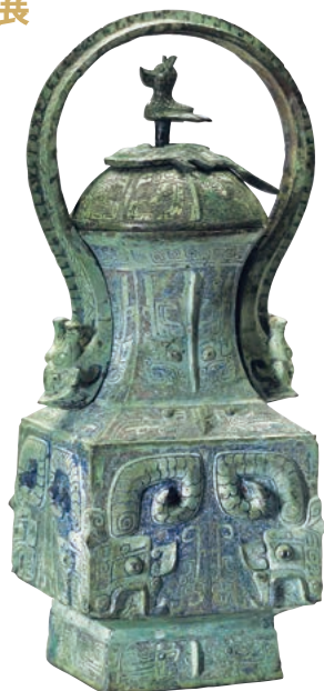
重要文化財 饗養夔龍文方卣 中国 殷(商)時代